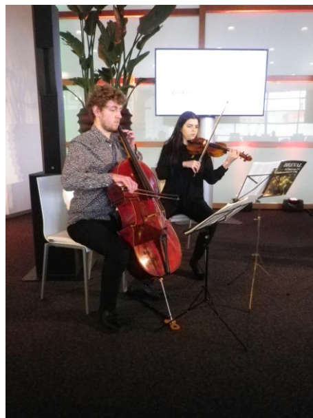
De muziek werd verzorgd door duo Jamin -Cello/Viool- van Fontys Hoogeschool voor de Kunsten.